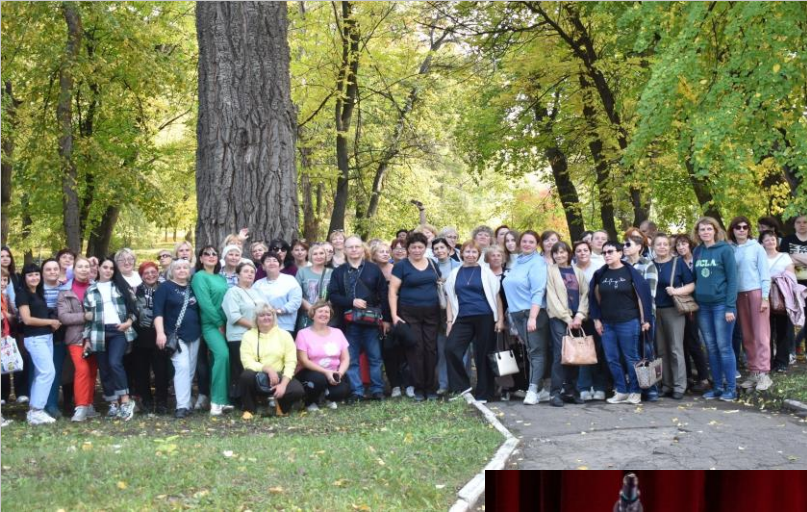
Корпоративный праздник «Скрепка»