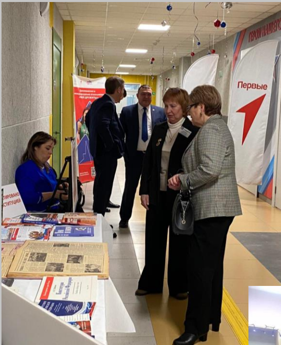
Заккрытие Года педагога и наставника