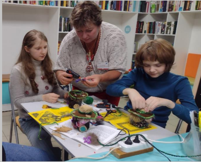
Мероприятия модельных библиотек по «Пушкинской карте»