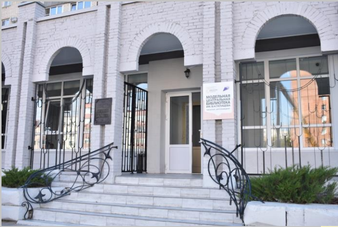
Модельная центральная библиотека им. В.Н. Татищева