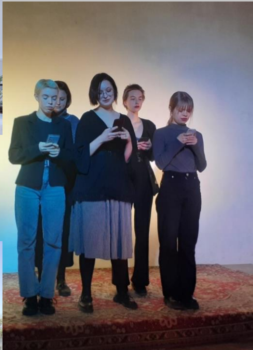
«Цифровая усадьба Орловых-Давыдовых», грантовый конкурс «Химия добра»